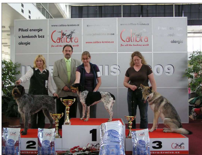
Vítězové BONB na MVP Intercanis Brno 27.6.2009: 1.místo ČSP Atina z Luční ulice

Druhou částí show je samotná soutěž - Velká národní cena. Té se zúčastňují na výstavě ocenění psi z každého plemene (CAJC, BOB a nejlepší veterán) a mezi sebou bojují o titul BONB - nejhezčí pes z národních plemen. Přestože strakáči mají proti ostatním, rozšířenějším plemenům obvykle množství handicap, i zde už jsme zaznamenali pěkná umístění. A není se čemu divit - strakáči jsou psi živí, temperamentní, v pohybu moc pěkní a přirození a navíc prostě česky líbí, takže umějí v konkurenci mnohem silnějších plemen zazářit a zaujmout.