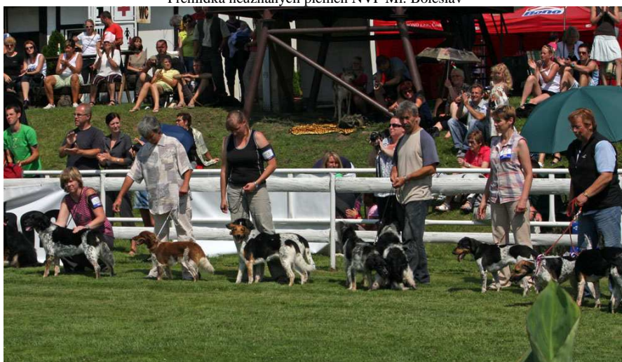
Přehlídka neuznaných plemen NVP Ml. Boleslav